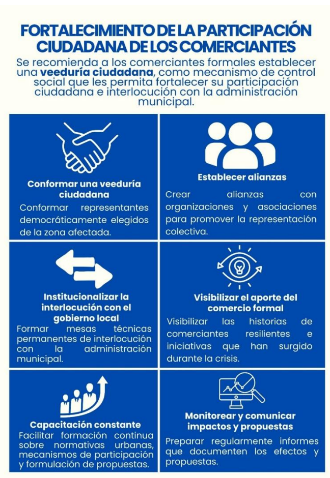
Imagen 2. Estrategia