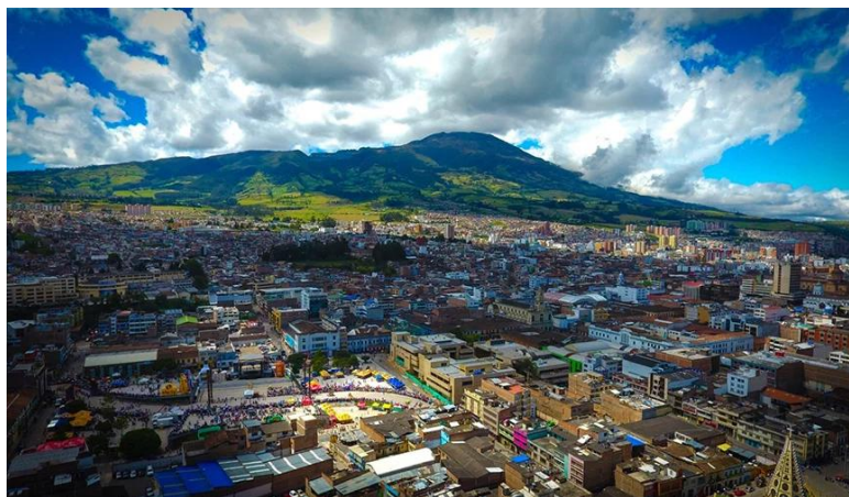
Ilustración 1. Ciudad de Pasto

Además, los parques y áreas verdes no solo contribuyen a la calidad de vida de los habitantes de Pasto, proporcionando espacios para el esparcimiento y la recreación, sino que también pueden influir positivamente en la economía local al atraer turistas y promover la inversión en infraestructura turística.