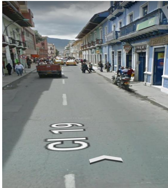
Ilustración 3. Calle 19 Carrera 27