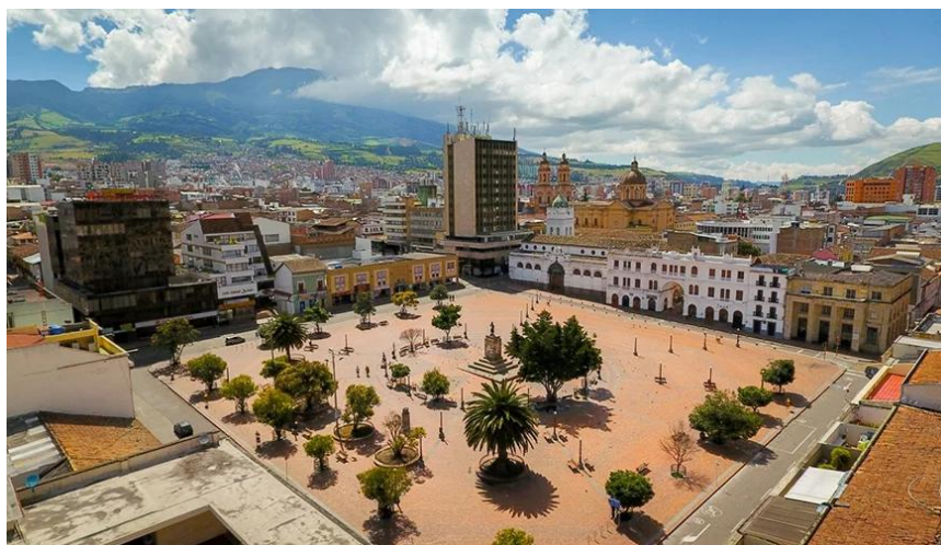
Ilustración 2. Plaza de Nariño Calle 19

1.4.3.2. Micro contexto. El micro contexto, en este caso, se refiere a un lugar específico de la ciudad de Pasto, que es la calle 19 entre las carreras 22 y 27. Esta descripción se basa en observaciones realizadas por las investigadoras en el terreno. Se considero aspectos como la morfología de la calle, el tipo de edificaciones, el flujo de tráfico y peatones, la presencia de comercios u otros establecimientos, y cualquier otro elemento relevante que pueda influir en el estudio o que sea de interés para la investigación.