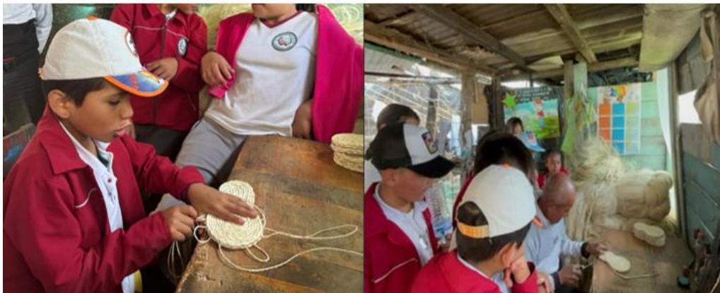
Fotografía proceso elaboración de alpargatas.