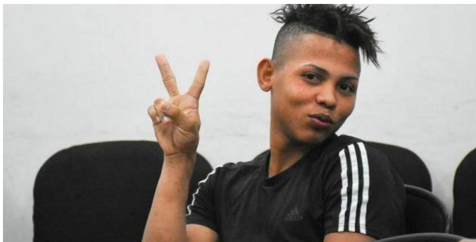
Imagen de noticia “INPEC responde a supuestos abusos contra 'Pupileto' antes de su muerte”

Nota: . Abril 16 de 2020.