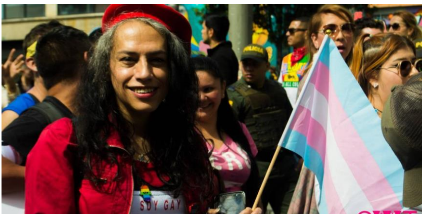
Imagen de la noticia “No cede la violencia contra la comunidad trans en Bogotá”