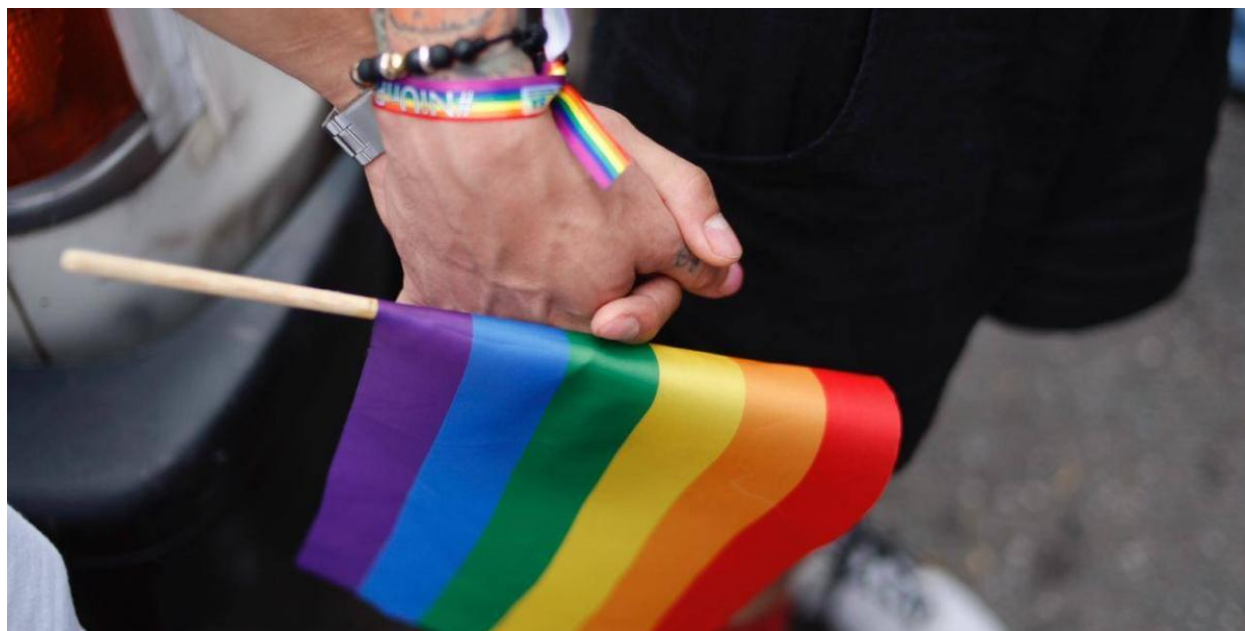
Imagen de noticia “Insultos a comunidad LGBTQ+ generan indignación en Manizales”

Nota: Imagen El Tiempo. Enero 31 de 2020. ( https://www.eltiempo.com/colombia/otras-ciudades/manizales-y-sus-polemicos-hechos-de-discriminacion-hacia-comunidad-lbgti-457310 )