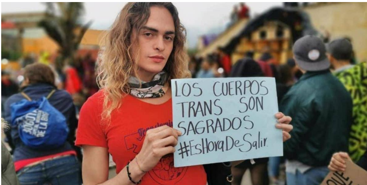
Imagen de noticia “Pico y género: 104 mujeres sancionadas y denuncias de comunidad trans”

Nota: .  Abril 13 de 2020.