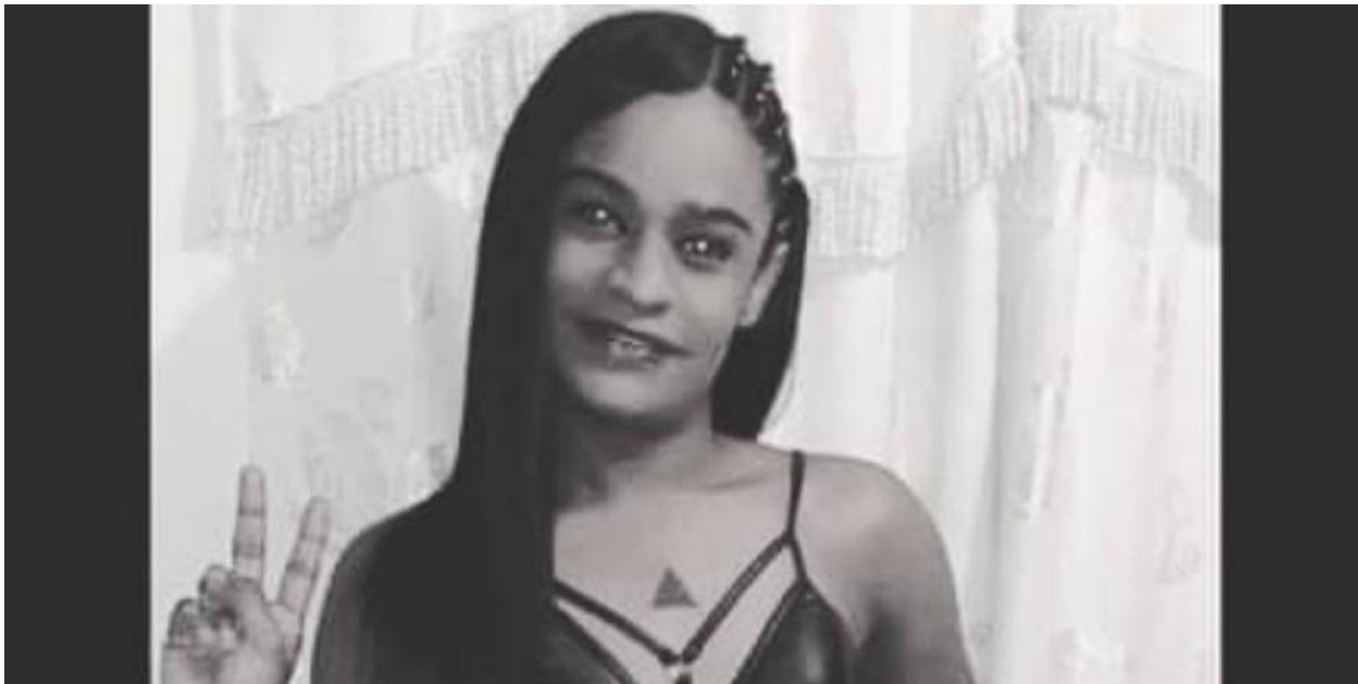
Imagen de noticia “Denuncian asesinato de mujer trans trabajadora sexual en Medellín”

Nota: Imagen El Tiempo. Junio 22 de 2020.