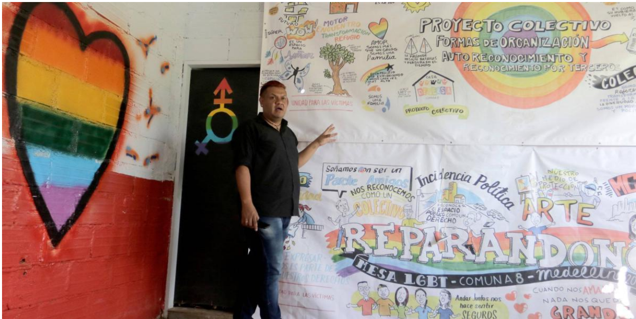
Imagen de noticia “Atacan a un líder de la comunidad LGBTI de Medellín”

Nota: Imagen El Tiempo. Febrero 12 de 2020.