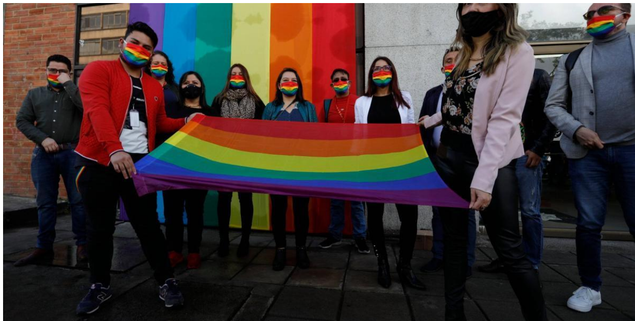
Imagen de noticia “Comunidad LGBTIQ denuncia nuevo ataque a joven en Sucre”