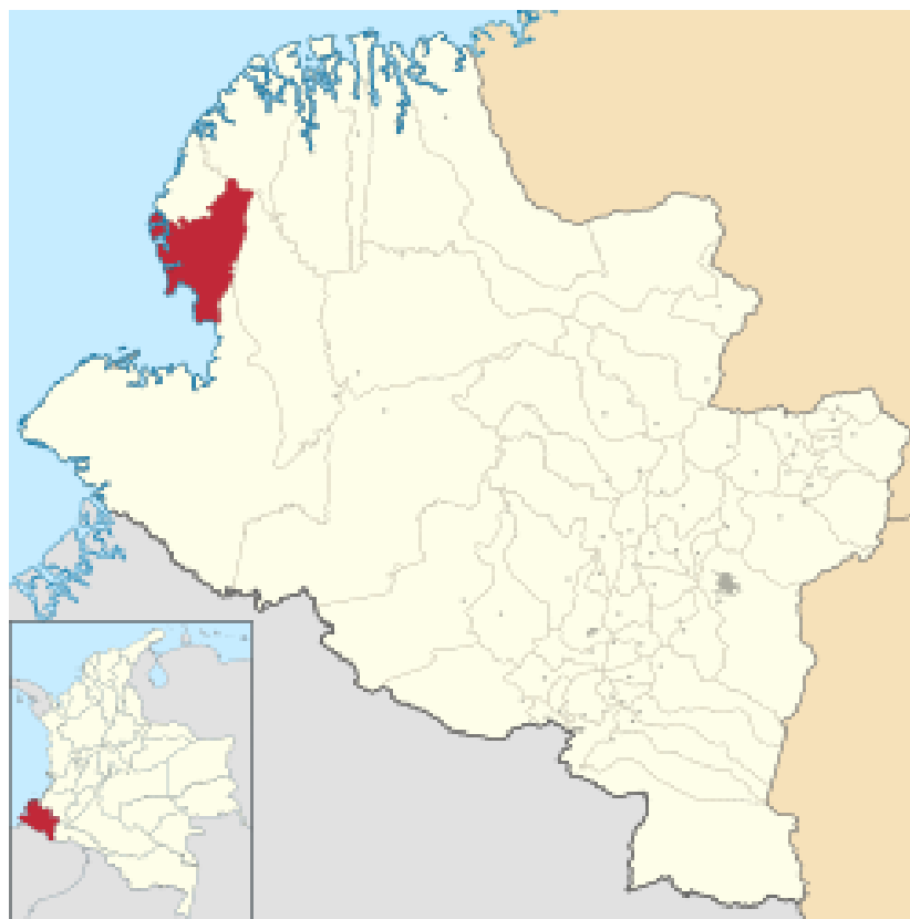
Ubicación Geográfica Municipio de Francisco Pizarro

Nota: Tomado Alcaldía Municipal Municipio de Francisco Pizarro (2020).