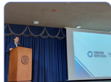
Participación de Fundación Grupo Social