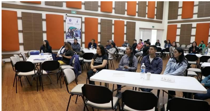
Figura 11. Organización de mesas de trabajo del evento de cierre