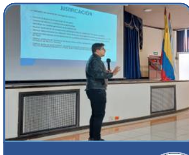
Registro Fotográfico evento de apertura

Registro fotográfico del Evento de apertura.