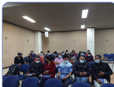
Asistentes al evento de apertura