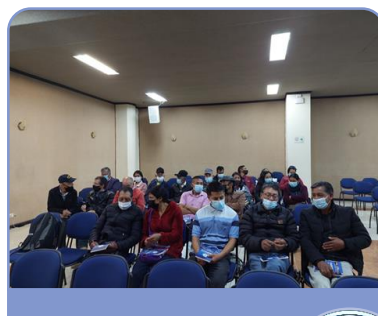
Asistentes al evento de apertura