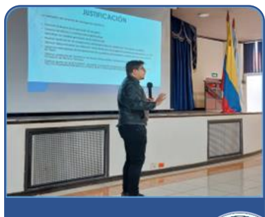
Registro Fotográfico evento de apertura

Registro fotográfico del Evento de apertura.