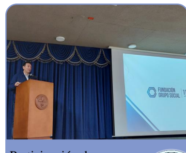
Participación de Fundación Grupo Social