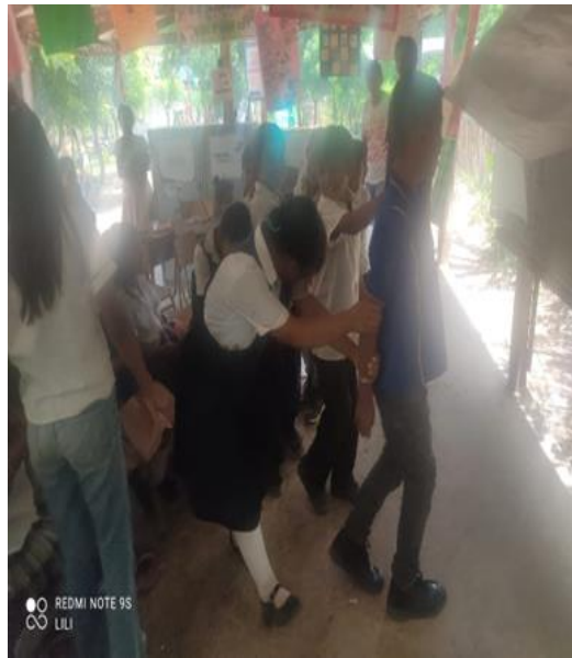
Actividad escolar de baile