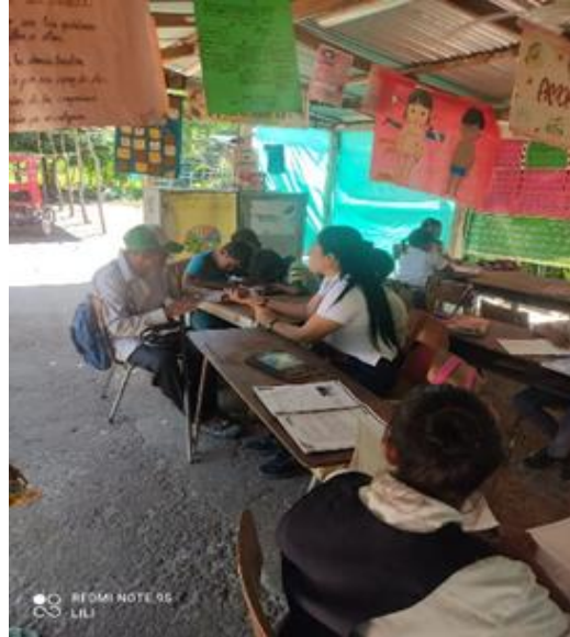
Clase sobre el maíz cariaco