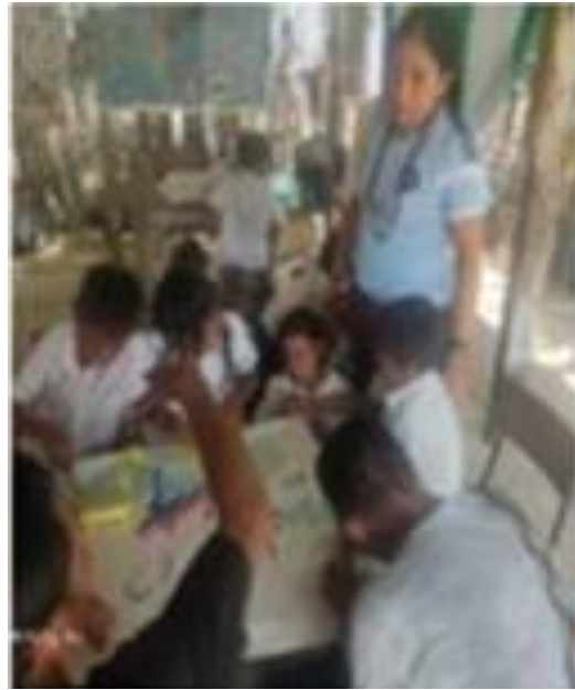
Dibujo historia del maíz