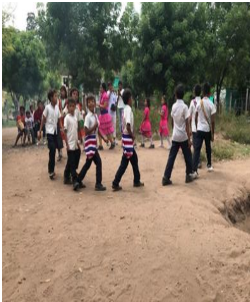
Baile del maíz carriaco