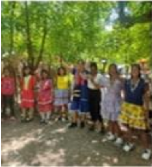
Socialización con la comunidad