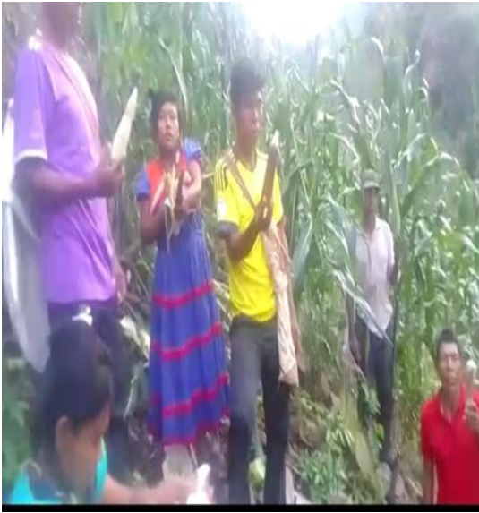
Cosecha del maíz carriaco