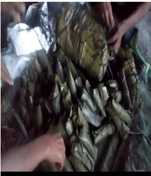
Elaboración de bollos preñados