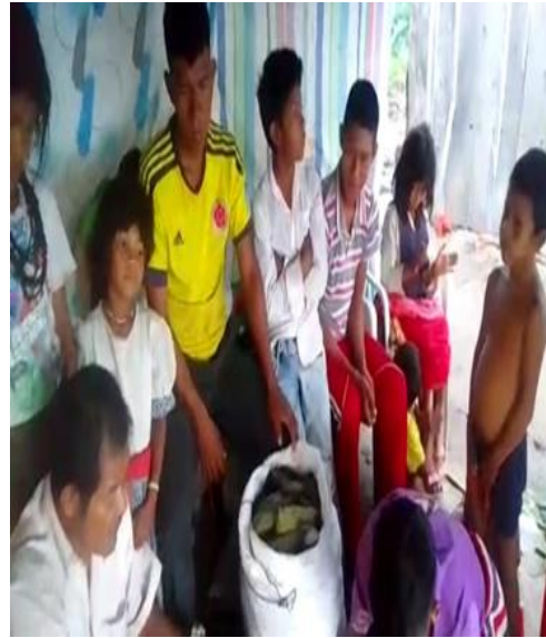
Cosecha del maíz carriaco