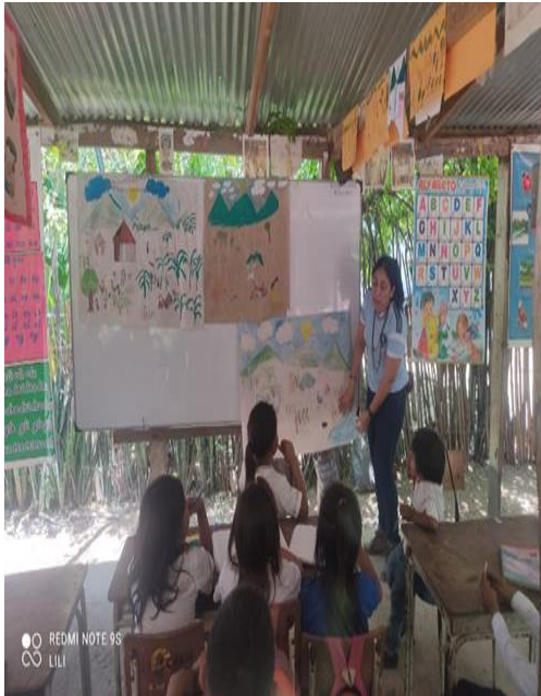
Pintura maíz carriaco