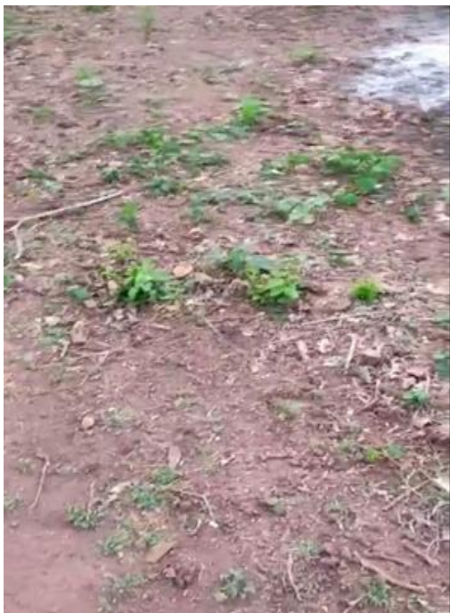
Preparación de la tierra