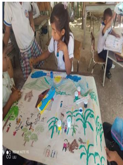
Concurso de pintura