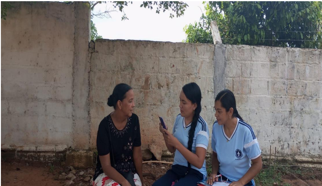
Realización de entrevista a una madre de familia