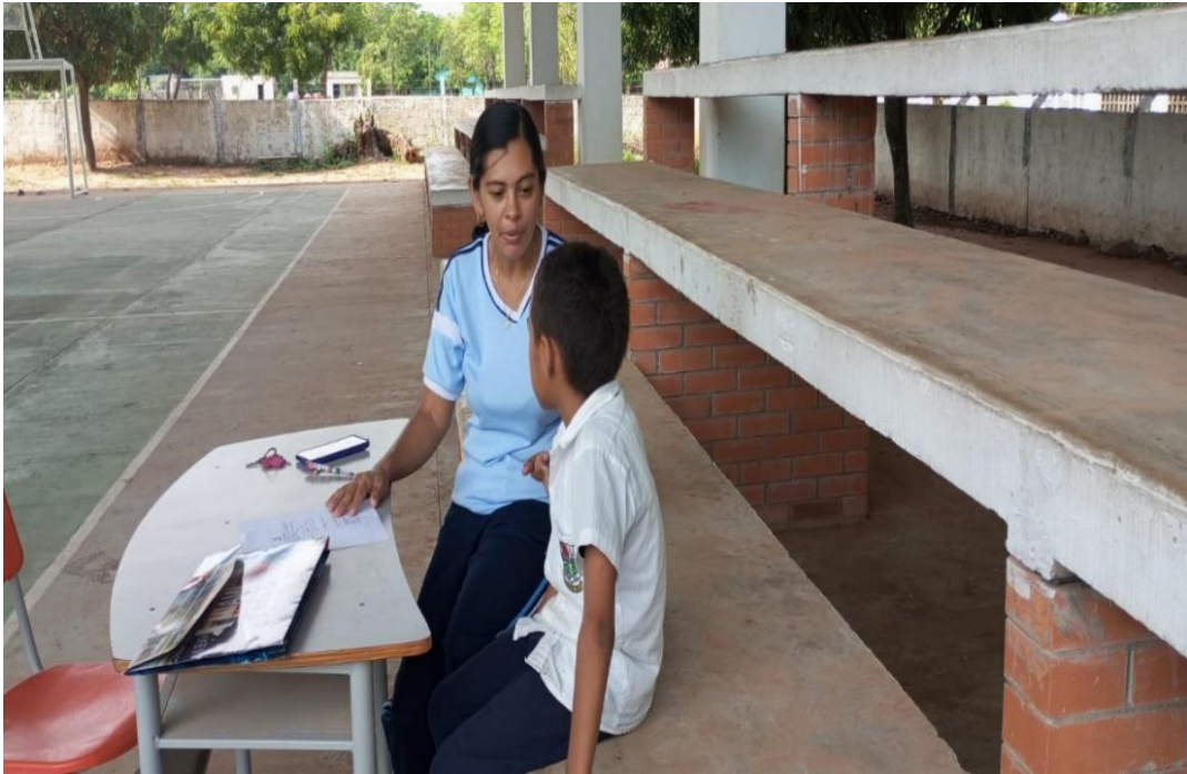
Realización de entrevistas a estudiantes.