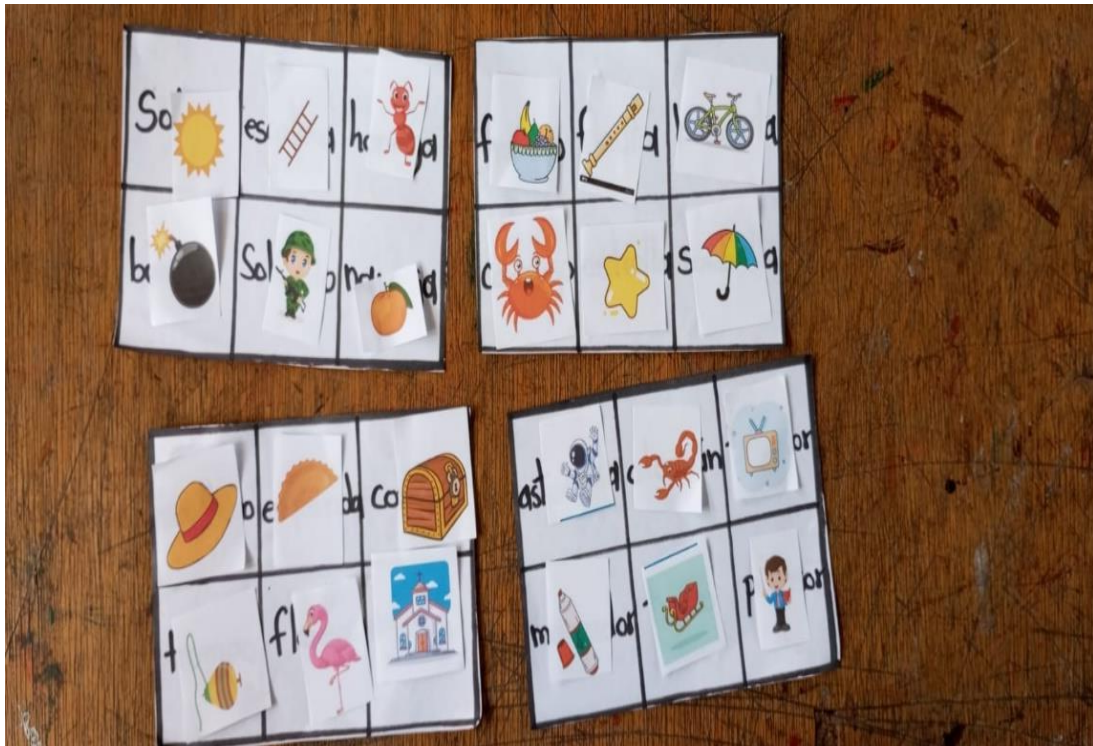
Bingos armados por los estudiantes.