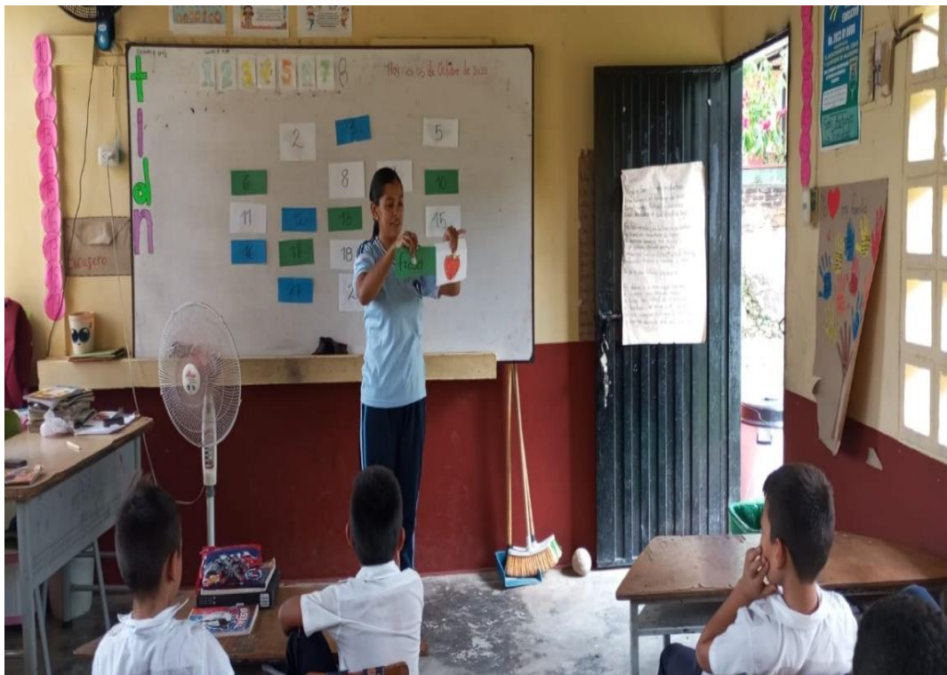
Aplicación de los concéntrese.