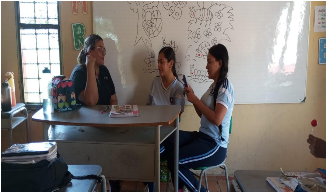
Realización de entrevista a la docente.