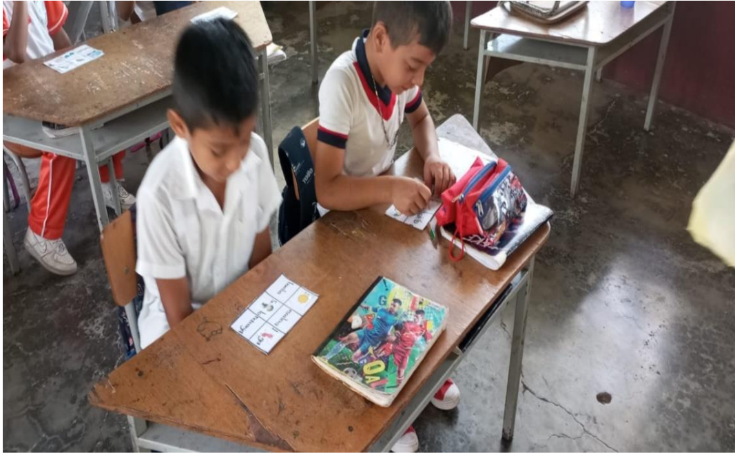
Implementación de una de las estrategias lúdicas: el bingo