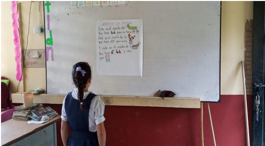
Lecturas de textos con pictogramas.